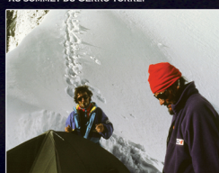
JERZY KUKUCZKA SUR LE LHOTSE (8611 M).